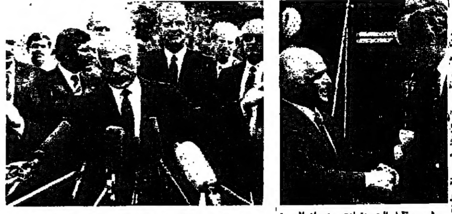
الحسين يتحدث الى الصحفيين بعد اللقاء ووراءه بيكر

في رسالة مفتوحة الى الرئيس الاميركي صدام: إي مواجهة اميركية مع العراق ستعيد آلاف الاميركيين الى بلادهم بالاكفان ويطهرون وامركم ويشتركون معكم في نهب اموال الامة. وذكر الرئيس صدام في الرسالة ان العرب هم الشعب انتم ابناؤا الامة الفخرية كما هاجمت الرسالة المصري حسني مبارك لقوله ان الرئيس العراقي اعطاه تاكيدات بأنه لن يهاجم الكويت. وقال صدام ان رواية حسني مبارك التي زعم فيها بان صدام حسين وعده بان لا يستخدم القوة العسكرية كاذبة بالذليل وبحضور ثمانية من المسؤولين العراقيين والمصريين على الاقل من ابناء وشبهوا على ذلك... ان لم احد حسني مبارك بشيء غير القول بانني ان استخدم القوة حتى ينقذ اجسام جده وقد دخلت القوات العراقية الكويت بعد حوالي ١٧ ساعة من النهار اجتمع جده. وفي وقت سابق قال وزير الخارجية العراقي طارق عزيز في مقابلة مع احدى شبكات التلفزيون الاميركية انه اذا شنت الولايات المتحدة حربا على العراق فسنتشر هذه الحرب (البقية على الصفحة ٩)